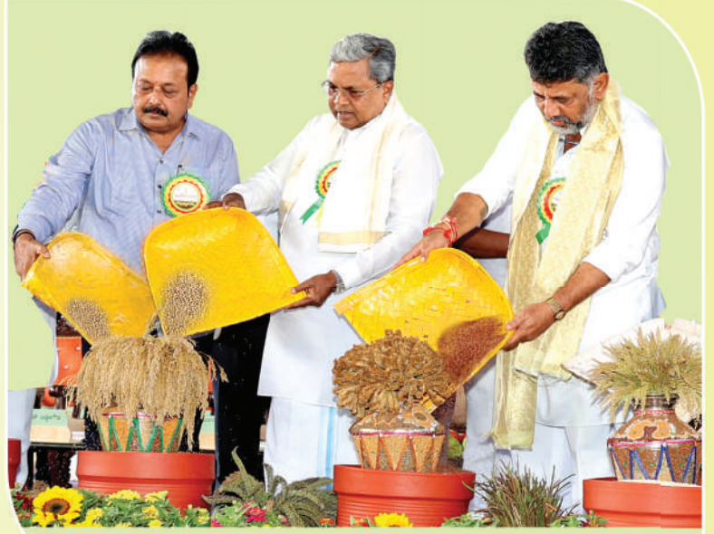
ಸನ್ಮಾನ್ಯ ಮುಖ್ಯಮಂತ್ರಿಗಳು ಹಾಗೂ ಮಾನ್ಯ ಉಪ ಮುಖ್ಯಮಂತ್ರಿಗಳೊಂದಿಗೆ ಮಾನ್ಯ ಕೃಷಿ ಸಚಿವರಾದ ಶ್ರೀ. ಎನ್. ಚಲುವರಾಯಸ್ವಾಮಿಯವರು ಕಾರ್ಯಕ್ರಮದ ಉದ್ಘಾಟನೆ ಮಾಡುತ್ತಿರುವುದು.

ಸಾವಯವ ಮತ್ತು ಸಿಲಿಧಾನ್ಯ : ಪರಂಪರೆಯ ಕೃಷಿ, ಭವಿಷ್ಯದ ಪ್ರೋತ್ಸಾಹ