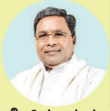
ಶ್ರೀ ಸಿದ್ದರಾಮಯ್ಯ ಸನ್ಮಾನ್ಯ ಮುಖ್ಯಮಂತ್ರಿಗಳು, ಕರ್ನಾಟಕ ಸರ್ಕಾರ