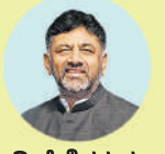
ಶ್ರೀ ಡಿ. ಕೆ. ಶಿವಕುಮಾರ್ ಮಾನ್ಯ ಉಪ ಮುಖ್ಯಮಂತ್ರಿಗಳು, ಕರ್ನಾಟಕ ಸರ್ಕಾರ